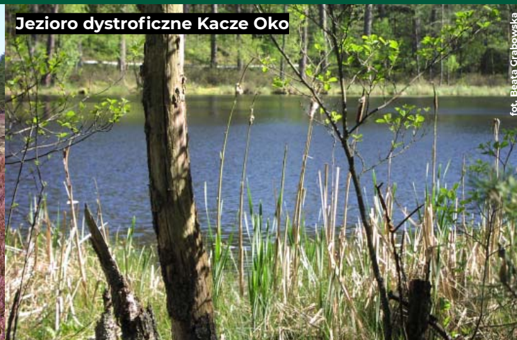
Jeziro dystroficzne Kacze Oko