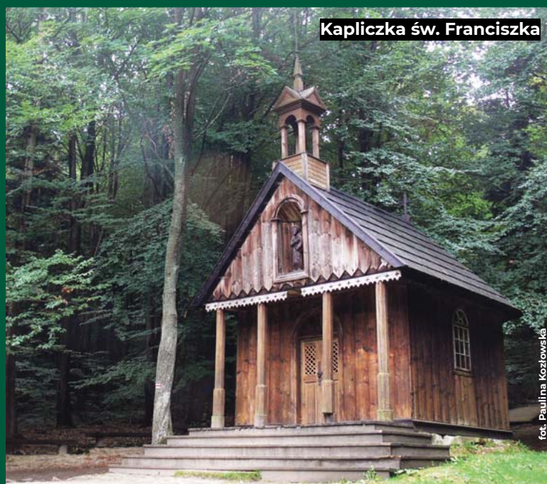
Kapliczka św. Franciszka