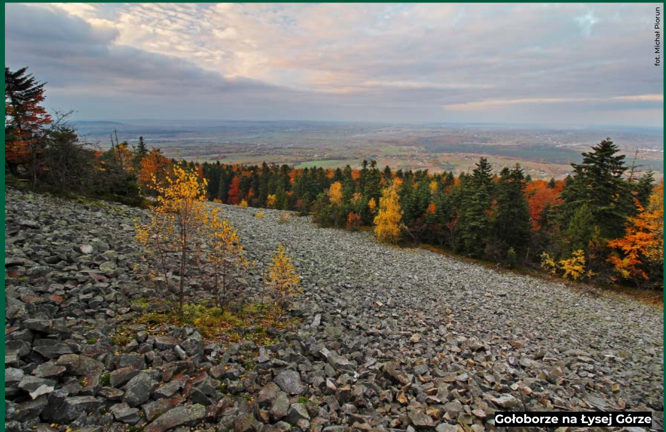
Gołoborze na Łysej Górze

POLSKIE PARKI NARODOWE. ŚWIĘTOKRZYSKI PARK NARODOWY